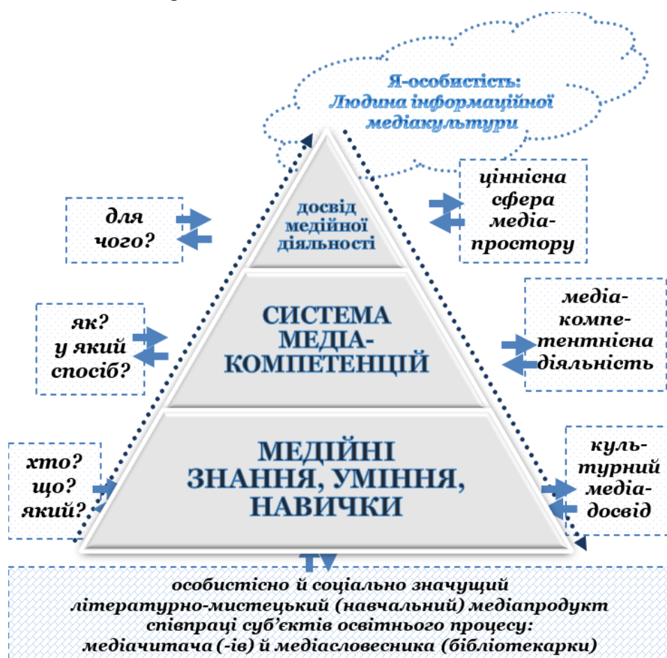
Рис. 2. Філософія медіаосвіти суб'єктів педагогічного процесу: пізнання/забезпечення співпраці суб'єктів та просторові складові конструювання моделі медіа- й ноосвітнього середовища

Із цією метою пропонуємо зацікавленим читачам модель «Філософія медіаосвіти суб'єктів педагогічного процесу» (рис. 2).