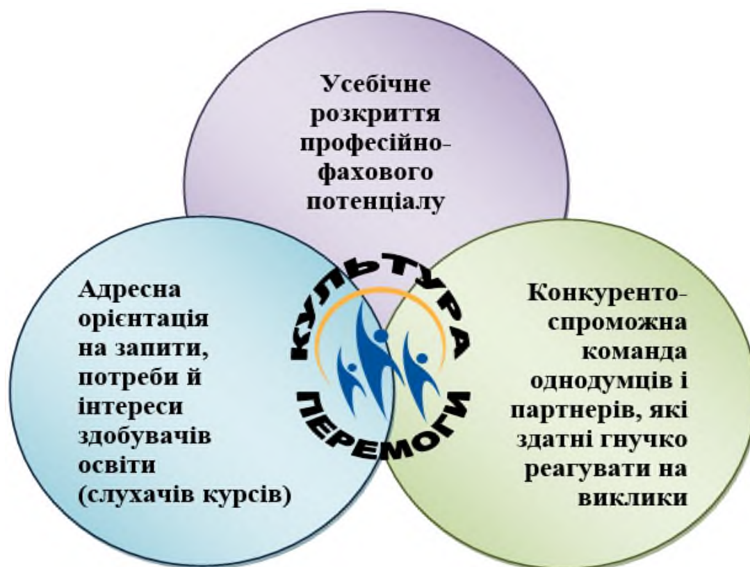
Рис. 1. Модель «Стратегія культури перемоги»

Повне розкриття професійно-фахового потенціалу містить у собі диверсифікувальний компонент.