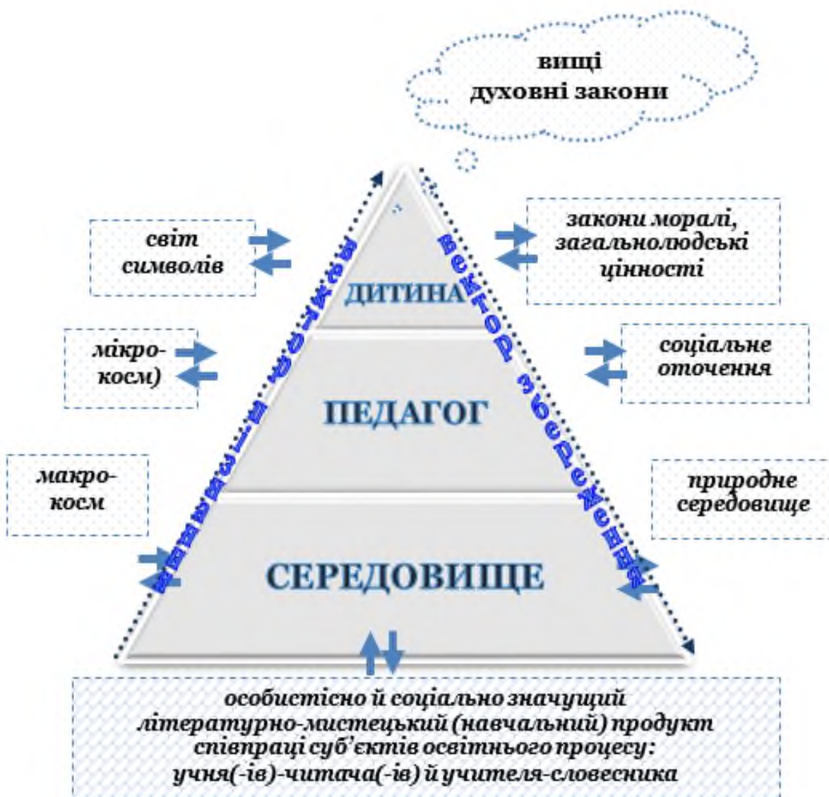
Рис. 1. Педагогіка добротоверення як стратегія і тактика пізнання/збереження співпраці суб'єктів та просторові складові конструювання моделі сучасного освітнього процесу (уроку/заняття) за ідеями Василя Сухомлинського

Освітнє середовище , за Василем Сухомлинським, це – навчання під «відкритим небом», у «зеленому класі» тощо. Стіни класної кімнати «відкриті» і «перенесені» в природну місцину, де відбувається спостереження за явищами, предметами, тваринним і рослинним світом та ін. До кожного явища чи події, тваринки чи звуків учні з учителем підбирали порівняння, епітети, метафори тощо. І той, хто міг вдало це зробити – був відкривач-творець, автор унікального тексту. Дуже важливо, щоб це середовище було безпечне, сприяло розвитку і давало можливість самореалізуватися дитині.