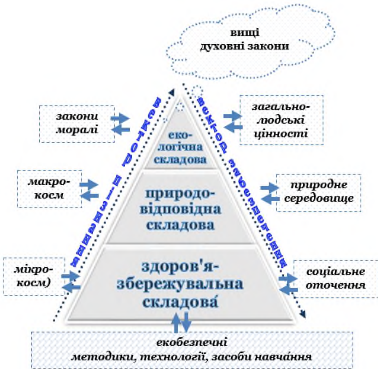
Рис. 3. Педагогіка природодоцільності як стратегія і тактика пізнання/забезпечення співпраці суб'єктів та просторові складові конструювання моделі сучасного освітнього процесу (уроку/заняття) за ідеями Василя Сухомлинського