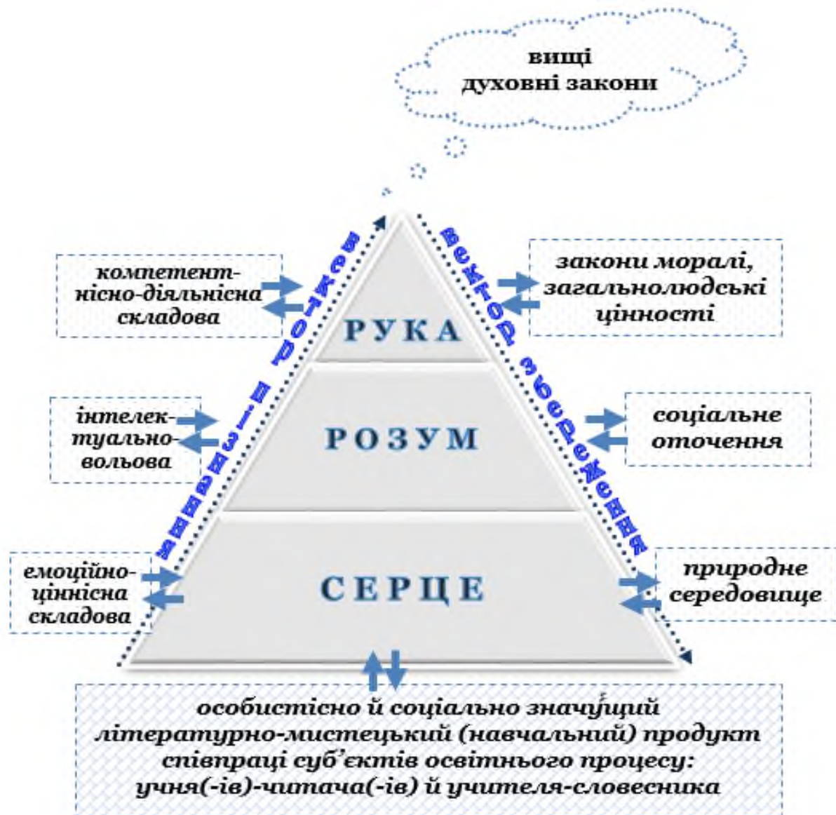
Рис. 4. Педагогіка серdecності як стратегія і тактика пізнання/збереження співпраці суб'єктів та просторові складові конструювання моделі сучасного освітнього процесу (уроку/заняття) за ідеями Василя Сухомлинського