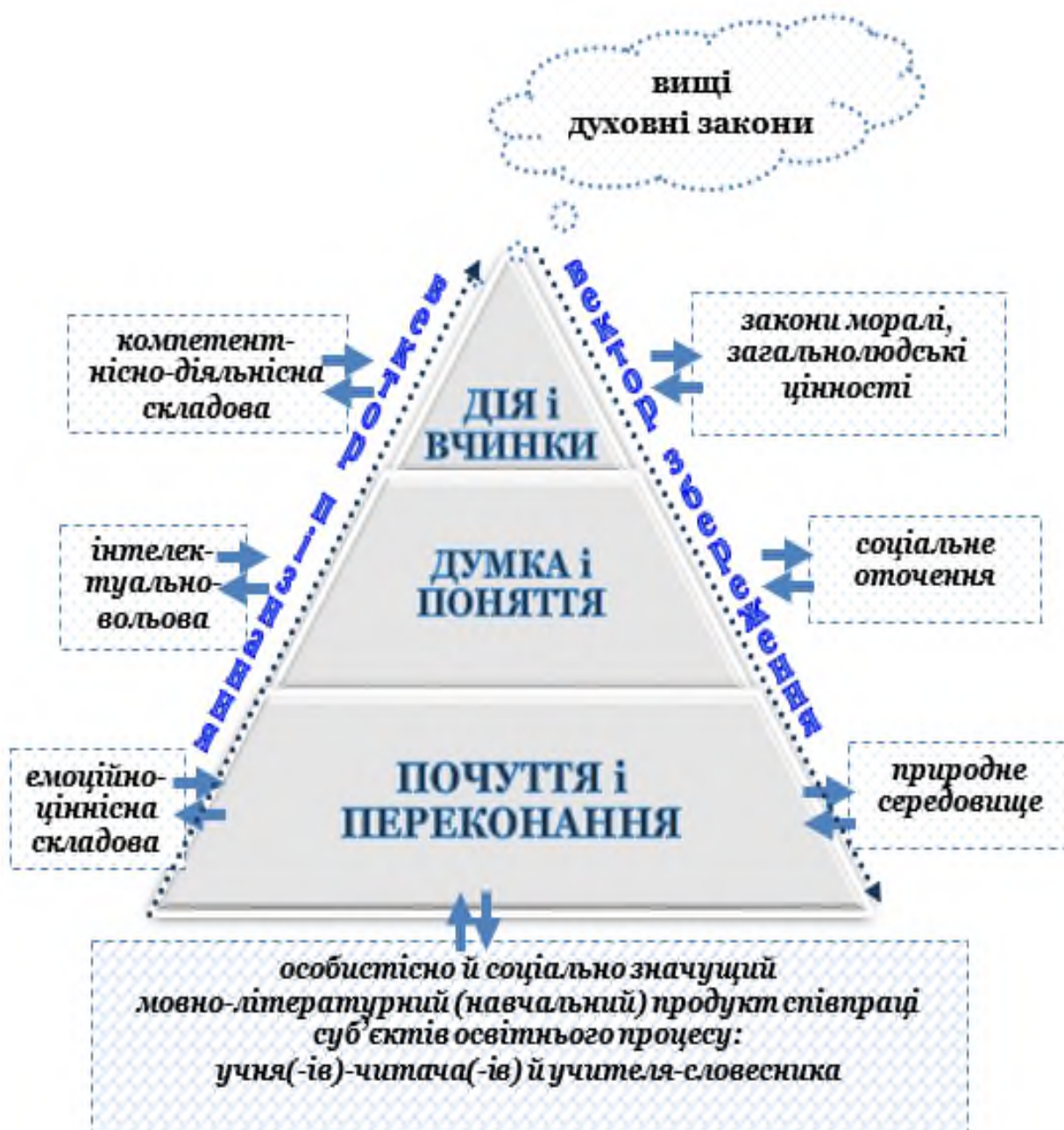
Рис. 2. Педагогіка гармонії як стратегія і тактика пізнання/збереження у співпраці суб'єктів та просторові складові конструювання моделі сучасного освітнього процесу (уроку/заняття) за ідеями Василя Сухомлинського

рішення і нести за них відповідальність, бути затребуваним і компетентним мовцем, який зможе комунікувати в різних життєвих і професійних ситуаціях. Вершинним на цьому шляху ЧИТАЧА – стати духовно багатим, інтелігентним читачем, демонструючи високий рівень ЛЮДИНИ КУЛЬТУРИ, яка здатна жити і діяти за вищими духовними законами і нормами.