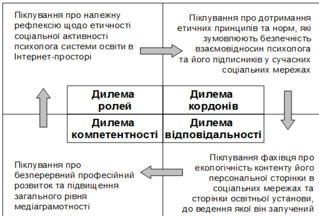
Рис. 3. «Загальна етична рамка поведінки психолога системи освіти в соціальних мережах»

4) піклування про належну рефлексію щодо етичності соціальної активності психолога системи освіти в інтернет-просторі (Рис. 3 «Загальна етична рамка поведінки психолога системи освіти в соціальних мережах»).