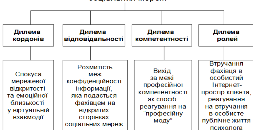
Рис. 1. Етичні дилеми під час вибору поведінкових стратегій психолога в соціальних мережах