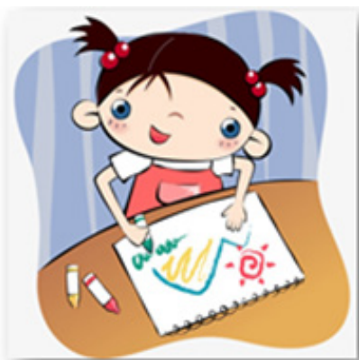
заняття (хобі, робота)