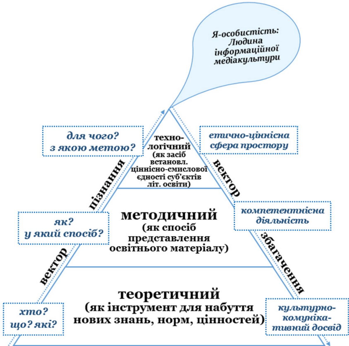
Рис. 1. Концептуальні складники моделі професійно-фахової студії філолога

на ідентичність: у фокусі – самовизначення майбутнього вчителя» (режим доступу: https://ooiuv.odessaedu.net/uk/news-1472-9324/ ).