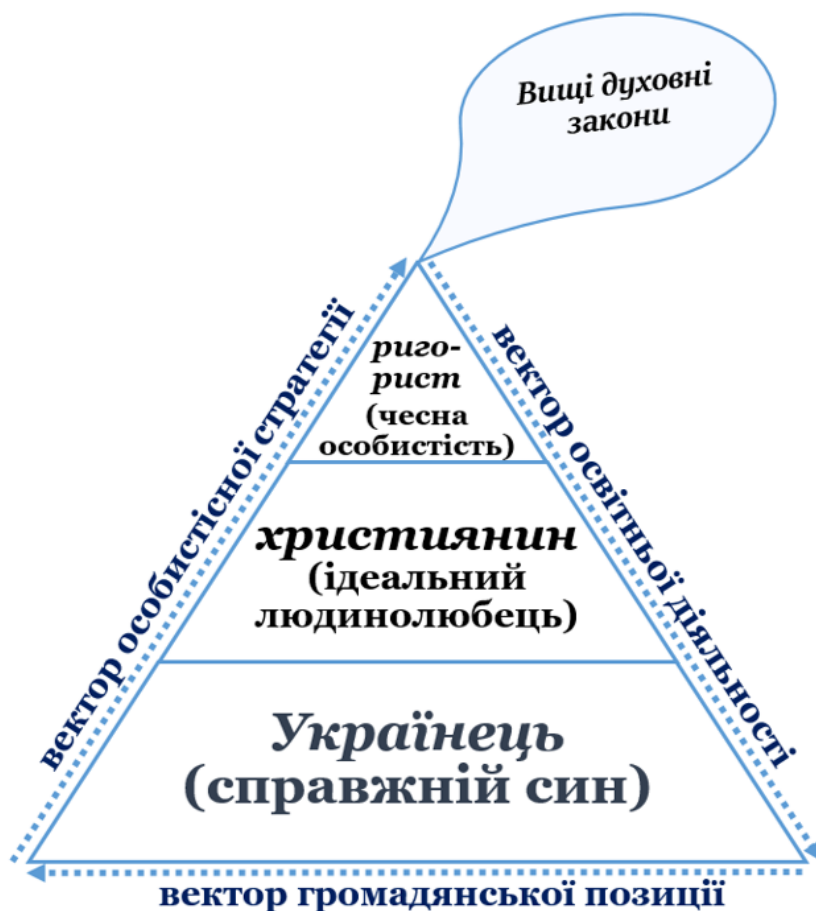
Рис. 1 Кордоцентрична модель творця гармонійної цільності Миколи Павловича Корпанюка