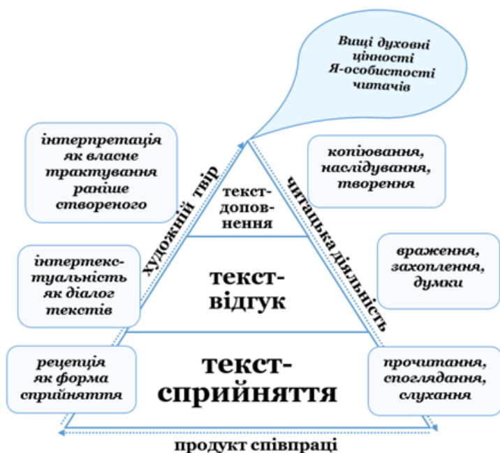
Рис. 1 Рецепція як поняття та його складники