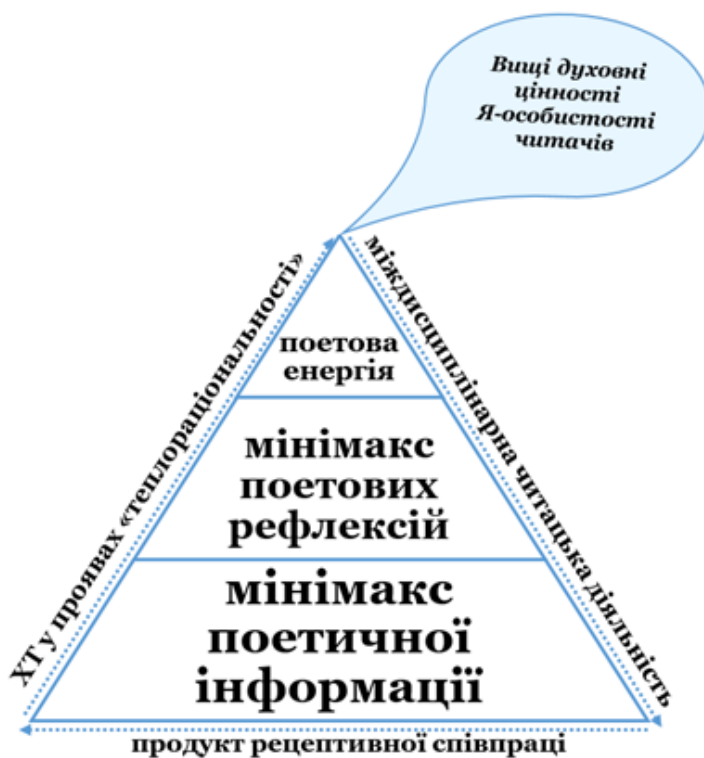
Рис. 2. Модель пошуку «ключа до серця читача» за твердженням Дмитра Кременя

Соціокультурна рецепція / соціокультурна компетентність як ціннісні феномени в системі літературної освіти учнів-читачів / глядачів / слухачів виконують низку соціокультурних функцій, про які йшлося в названій вище статті.