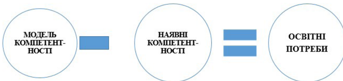
Рис. 2. Визначення освітніх потреб педагогів

3. Визначення освітніх потреб у формі різниці між необхідними та розвиненими компетентностями. Проектування змісту підготовки (рис. 2).