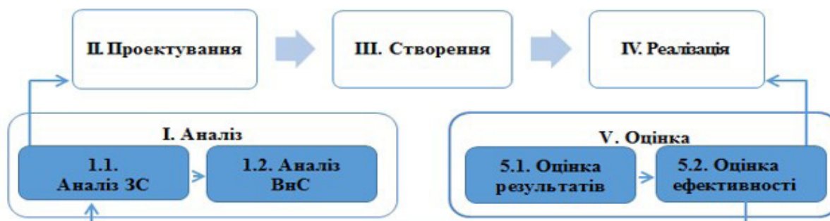
Рис. 3. Етапи проектування та впровадження моделі підготовки керівних кадрів до організації мережевого профільного навчання в умовах регіону

Два перших і два останніх етапи об'єднуються за ознакою спільної дії (аналіз, оцінка) у групи. Обидві групи на вході і виході міститимуть зовнішній (середовищний) та внутрішній (особистісний) етапи (рис. 3.). Перша група детермінуватиме сутність етапів проектування, створення, реалізації, а остання – визначатиме їх якість.