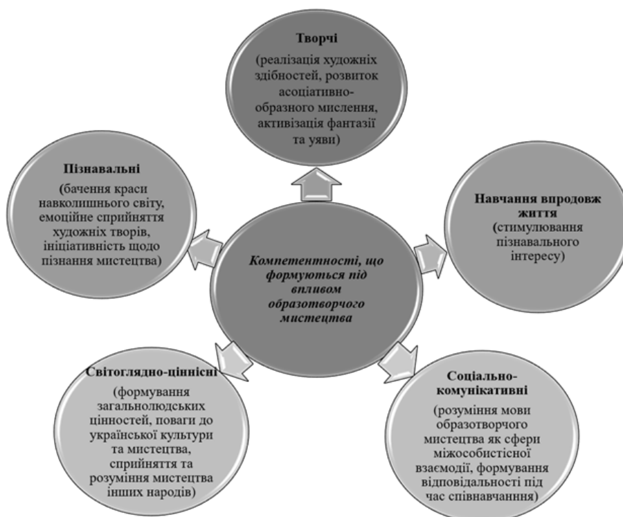
Рисунок 2. Компетентності, що формують під впливом образотворчого мистецтва

Відчуття особливостей художнього мистецтва дає поштовх до поглиблення та розширення загального розвитку молодшого школяра, формує в нього здорову моральну основу, повагу до праці, любов до людей, гуманне ставлення до природи, бажання зрозуміти філософську сутність предметів, пізнати свій внутрішній світ. Дитина, що навчилася міркувати в деталях та одночасно усвідомлювати життя на землі в глобальному вимірі та чуттєво, діятиме в рамках моральних основ і відповідно до етичних норм.