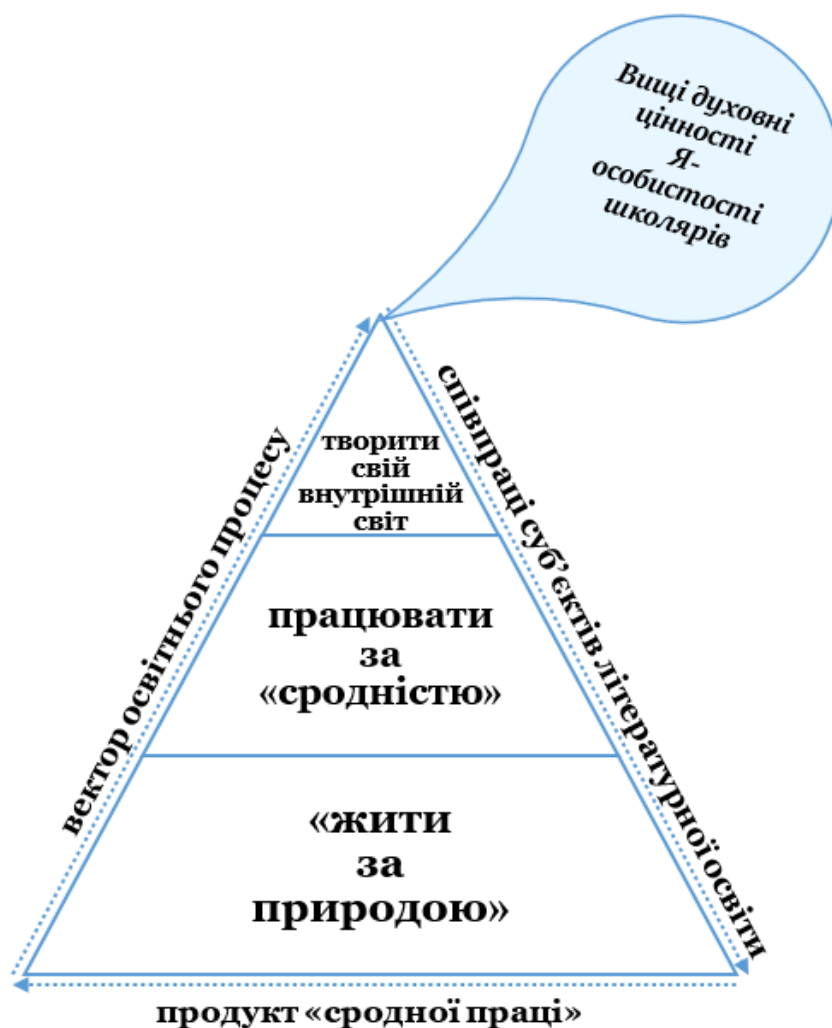
Рис. 3. Модель духовної цілості «щасливої людини» (за ідеями Гр. Сковороди)