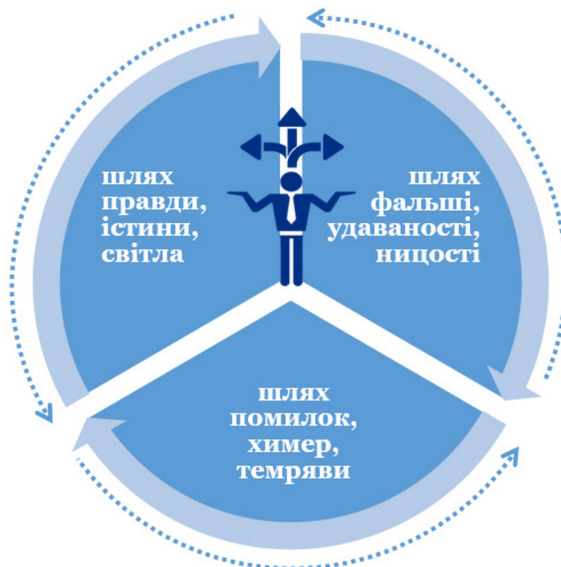
Рис. 2. «Тривимірність» світу за Гр. Сковородою і вибір учнів-читачів

Ціннісні орієнтири можуть вибудовуватися за однією з моделей, яку подаємо на рис. 2.