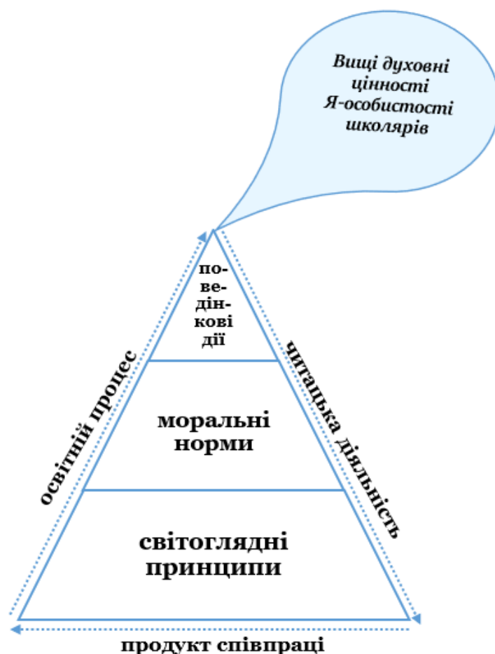
Рис. 1. Трансформаційні процеси духовного освітнього процесу