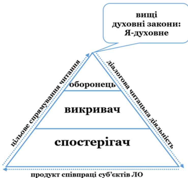
Рис. 1. Ціннісно-етична поведінкова модель Василя Стефаника

Описане вище можемо подати логіко-семіотичною моделлю, що репрезентує ціннісно-етичну поведінкову модель життя й діяльності Василя Стефаника (рис. 1):