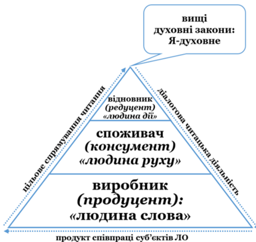
Рис. 2. Модель інтелігентного націозорієтованого читача в новій системі літературної освіти

нальну ідею, вибудовувати ціннісно-етичну поведінкову модель, бути патріотами своєї країни, жити в гармонії з природою та самим-собою, займати активну громадянську позицію, не порушуючи вищі духовні закони та норми. Цьому сприятимуть літературні твори, художньо-документальні, історіографічні тексти, літературно-критичні праці, культурологічні матеріали та медіатексти. У теорії В'ячеслава Липинського (лист «Про роль письменника-публіциста в процесі національної творчості») визначено опосередковані вимоги до письменника ( і не тільки – прим. наша ) у стані «організації перемоги для армії» та типи людей, які живуть / діють під час воєнних дій: «... людей діла, людей руху, ... людей слова ...» (Липинський В. К., 1926, с. 114). Можемо запропонувати варіант моделі сучасного інтелігентного націозорієтованого читача в новій стратегії розвитку літератури та ноометодики / ноотехнології в системі літературної освіти: