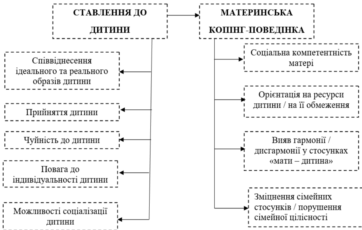
Рис. 2. Схема формування материнської копінг-поведінки

Зважаючи на зміст схеми, ефективність материнської копінг-стратегії доцільно розглядати залежно від контексту та умов конкретної ситуації, у якій її варто використовувати чи здійснювати. Успішність в одній стресогенній ситуації не гарантує її результативності в іншій. Крім того, ефективність певної копінг-стратегії залежить не тільки від реальної ситуації, але і від її індивідуального когнітивного оцінювання, критеріями якого є низка характеристик, описаних на об'єктивному та суб'єктивному рівнях (контрольованість, тривалість, інтенсивність, високі вимоги до ресурсу адаптації).