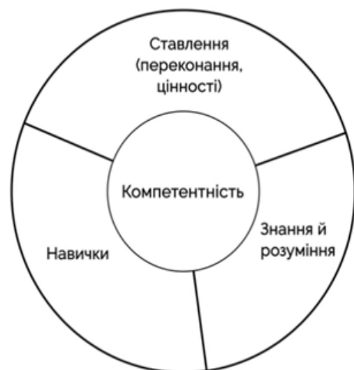
Схема 2. Складові поняття «компетентність» із Концепції «Нова українська школа»

яка поєднує окремі частини нашого мозку й допомагає їм працювати разом як єдине ціле. Інтеграція – поєднання окремих елементів будь-якого цілого для забезпечення належного функціонування цього цілого. Інтеграції протистоять процеси дезінтеграції, тому нашим завданням є допомогти дітям стати більш інтегрованими, щоб вони сповна могли використовувати можливості мозку. Наприклад, ми прагнемо, щоб вони були горизонтально інтегрованими, тобто щоб їхня ліва півкуля, яка відповідає за логіку, могла добре співпрацювати з правою півкулею, яка відповідає за емоції. Також ми хочемо, щоб вони були вертикально інтегрованими, тобто щоб ті частини їхнього мозку, які відповідають за вищі психічні функції і дають змогу свідомо керувати своїми діями, працювали злагоджено з частинами мозку, які відповідають за нижчі психічні функції, за інстинкти, підсвідомі реакції, виживання. Такі дані спираються на нейробіологію, яка відкрила «пластичність» мозку, тобто його здатність формуватися протягом усього життя [6]. Узагалі інтеграція горизонтального і вертикального зростання менталітету людини є запорукою сталого розвитку суспільства в цілому.