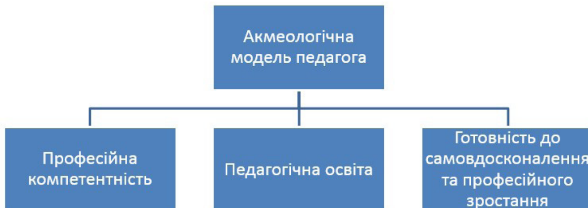
Рис. 3. Акмеологічна модель сучасного педагога

акмеологічна модель сучасного педагога має три складові: