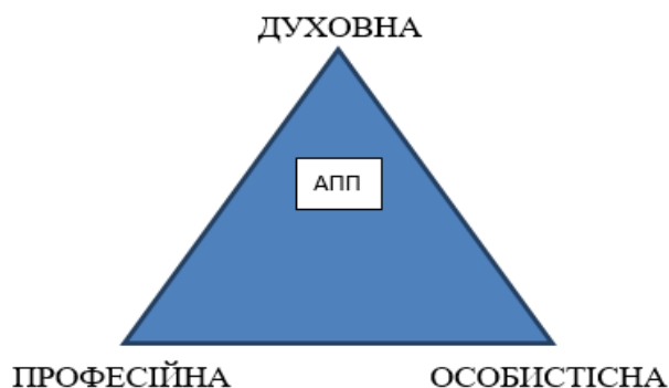
Рис. 2. Акмеологічна модель педагога

Засновницею шкільної акмеології є професор В. М. Максимова. Шкільна акмеологія вивчає вершини розвитку суб'єктів освітнього процесу школи ( педагогів та здобувачів освіти ). Для педагогів – це професіоналізм і компетентність, для здобувачів освіти – розвиток самоорганізованої особистості.