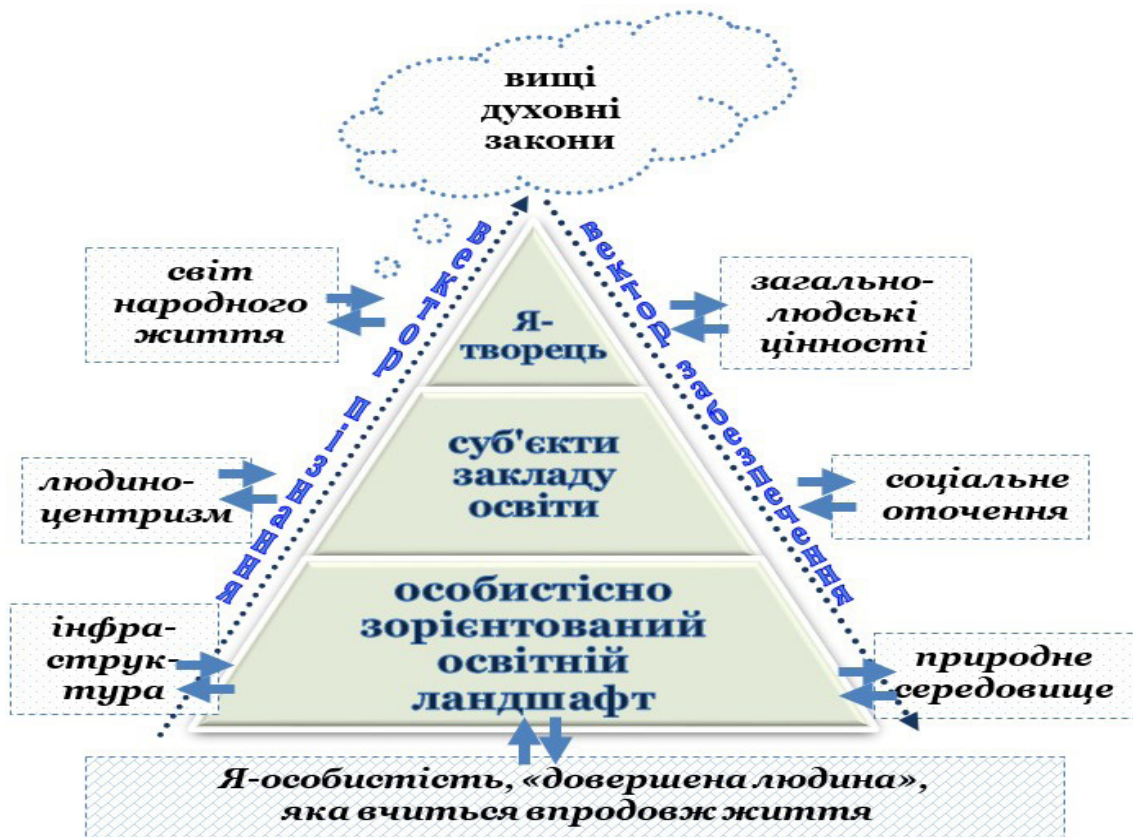
Рис. 1. Персоналізована акмемодель розвитку особистості суб'єктів Нової української школи

1) взаємодія як суб'єктний компонент передбачає участь усіх суб'єктів освітньо-го процесу під час сприйняття і взаємодії з об'єктами вивчення в умовах безпосеред-